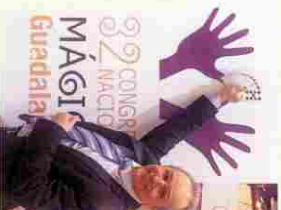
Carlos Serrate Presidente del Congreso

Es esta, sin duda, una ocasión única y muy especial para todos nosotros. Unos días para compartir, aprender, tender nuevos puentes entre disciplinas, establecer sinergias que generen conocimientos novedosos para producir no solo explicaciones nuevas a problemas de siempre, sino soluciones creativas a los nuevos desafíos con que nos enfrentamos los magos.