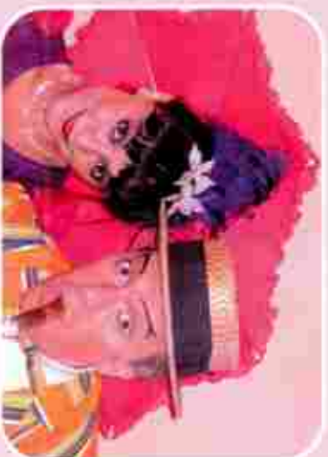
BRANDO Y SILVANA